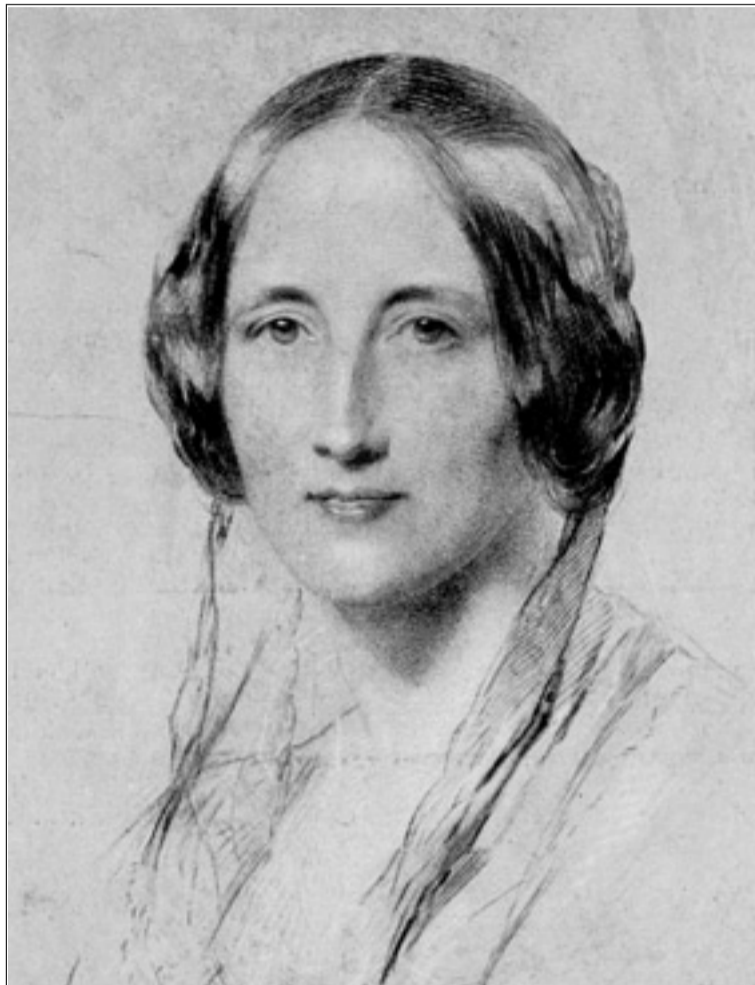
'Ruth', que se presenta por primera vez en castellano, es una obra imprescindible para completar la magnífica labor literaria de la escritora victoriana Elizabeth Gaskell que en nada tiene que envidiar a sus famosos amigos Charles Dickens o las hermanas Brontë.

En medio de tanta crisis económica nos ha sorprendido la grata noticia de que la editorial asturiana dÉpoca irrumpe en el mercado del libro rescatando del anonimato títulos a los que la industria editorial española había ignorado en sus traducciones. Obras esencialmente del siglo XIX que suponen un rico y valioso legado de escritores con una creciente vigencia en nuestros días. Es el caso de 'Ruth', la única de las novelas de la escritora inglesa Elizabeth Gaskell (1810-1865) que permanecía hasta ahora inédita en España, a la que dÉpoca le dedica en esta primera impresión en castellano un especial cuidado tanto en el aspecto material del libro como en su contenido. A unos esenciales datos biográficos y comentarios sobre la obra se acompaña material fotográfico que favorece el acercamiento a la vida y la obra de esta escritora que compartió con su amigo Charles Dickens época, trabajo y fama, además del mismo interés en fustigar la encorsetada conciencia de la sociedad victoriana.